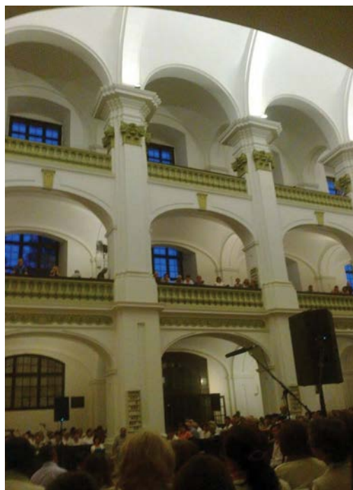
Veľký kostol v Békešskej Čabe

Okrem mojej krstnej mamy má niekoľko ďalších blízkych ľudí svoje korene v národnostne zmiešaných miestach v susedných štá-