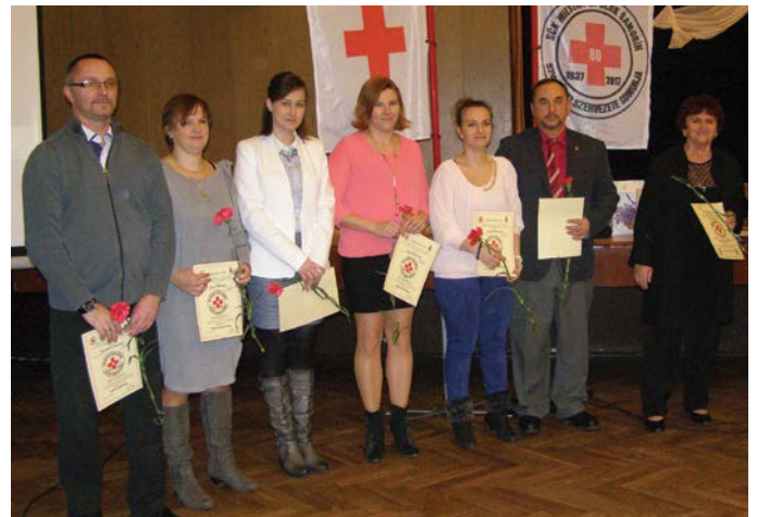
A jelenlegi vezetőségi tagok

Az évzáró taggyűlés során a jelen levő érdeklődők a művelődési központ előcsarnokában megtekinthették azokat a segédeszközöket, tárgyakat, amelyek nélkülözhetetlenek az