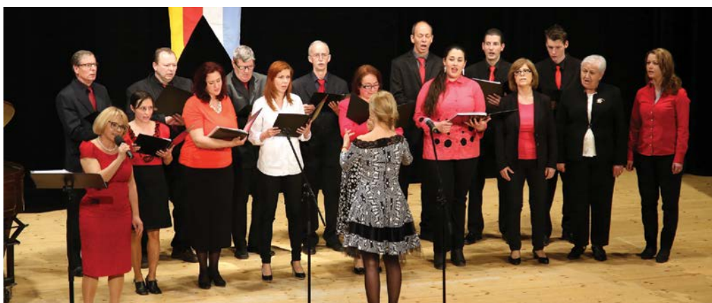
Spevácky zbor Sancta Maria

Jarné trhy na Hlavnom námestí – 18., 19., 20. máj 2017