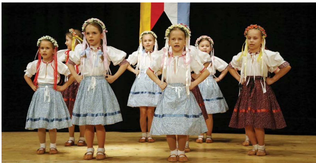
Folklorný súbor Prvosienka

„Nech je dnešný večer príkladom toho, že ešte máme skutočne duchovné a emocionálne hodnoty, hoci na neraz zabúdame a neoceňujeme ich patrične. Nech je táto udalosť aj mementom, že našim hodnotám nevenujeme dostatočnú pozornosť adekvátnu ich významu, a uvažujeme nad nimi len vtedy, keď sme konfrontovaní