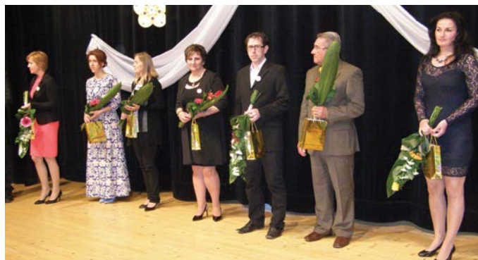
Az elismerésben részesültek

dését is jelenti. Az önkormányzat az iskolák és oktatási létesítmények igazgatói, valamint az iskolatanács és az iskola-fenntartók javaslatára minden évben kitüntetések adományoz azoknak az oktatóknak, akik nemcsak eredményesen végzik pedagógiai munkájukat, hanem azon túl is fáradhatatlanul munkálkodnak