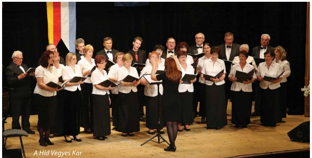
A Híd Vegyes Kar

„Legyen ez a mai este annak példázata, hogy vannak még valós szellemi és érzelmi értékeink, amelyeket időnként még fel tudunk fedezni, s megpróbáljuk azokat értékelni, a megfelelő helyen kezelni. De legyen ez az esemény egyben figyelemztetés is arra, hogy értéke-