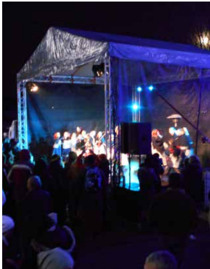
Na vianočných trhoch v Čilistove pri hoteli Kormorán so svojim vystúpením zožala veľký úspech u publika aj detská folklórna skupina Prvosienka. (ti)