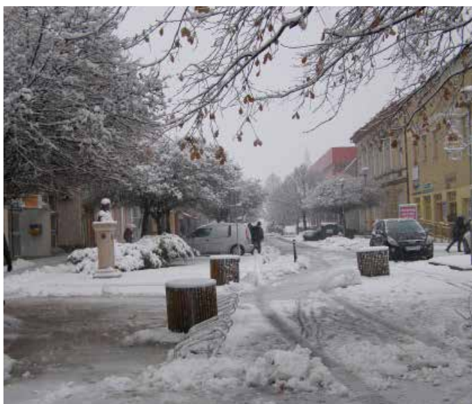
30. novembra sme sa prebudili do zimného rána, keď v noci krajinu pokryla hrubá vrstva snehu.

Korvína, výzdoba kruhového objazdu na Čilistovskej ceste je dielom Základnej umeleckej školy Štefana Németha-Samorínskeho. Výzdoba kruhového objazdu na Hlbokej ulici bola tento rok úlohou Centra voľného času Kukukónia a kruhový objazd pri kultúrnom stredku získal vianočný šat vďaka Materskej škole s výchovným jazykom maďarským na Školskej ulici. Výzdoba Mliečna je dielom žiakov miestnej málotriedky, dva stromy pred mestským úradom ozdobil Materská škola na Ulici Márie a výzdoba fontány je dielom Materskej školy na Dunajskej ulici. (ti)