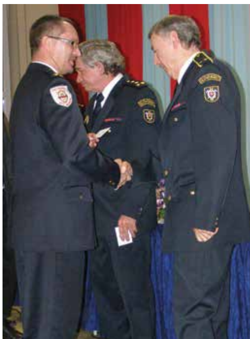
Rangemlésekre, kitüntetések, elismerések átadására is sor került.