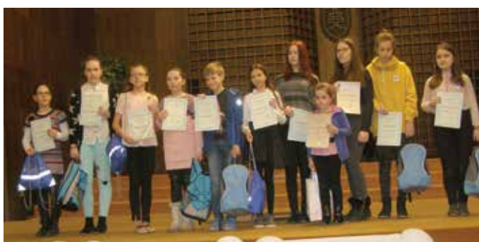
A rajzverseny díjazottjai

Iskoláink tanulói nagy örömmel vettek részt a rendez-