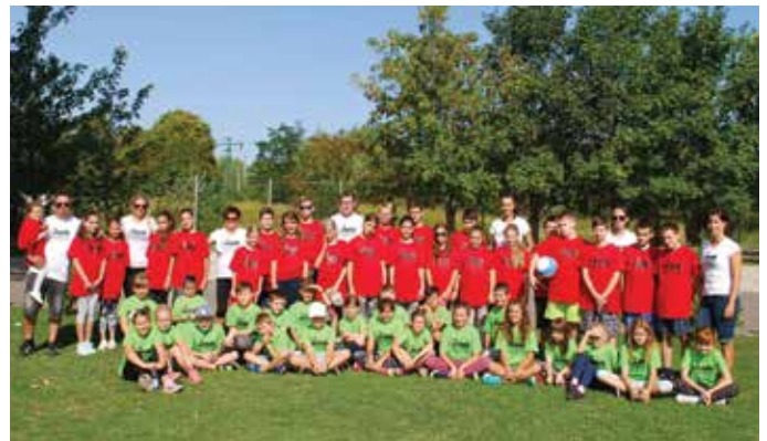
Nagy népszerűségnek örvend a nyaranta megrendezett Csemadok Kalandtábor

– A legfontosabb feladatunk a jövőben az, hogy csoportjaink folyamatos munkáját és anyagi hátterét biztosítani tudjuk. Rendszeresen pályázunk, és az önkormányzat is támogatja munkánkat. A március 11-ei tagsági gyűlés bizalmat szavazott nekem és az új elnökségi tagoknak. Azon leszünk, hogy erre a bizalomra rászolgáljunk. Az elkövetkező években biz-