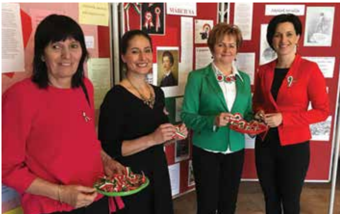
A Csemadok alapszervezetének vezetőségi tagjai március 15-én kokárdát osztottak a Madách Imre Gimnáziumban

mán. Említhetném a március tizenötödikei megemlékezéseket, a Szent István Napokat, az adventi koncerteket bezárólag. Meseírópályázatot rendezünk a tejfalui alapszervezettel karöltve, a gyerekeknek táborot szervezünk a nyár folyamán, és a sok-sok rendezvény mellett fenntartói vagyunk a Csalló Néptáncegyüttesnek, a Híd Vegyes Karnak, valamint