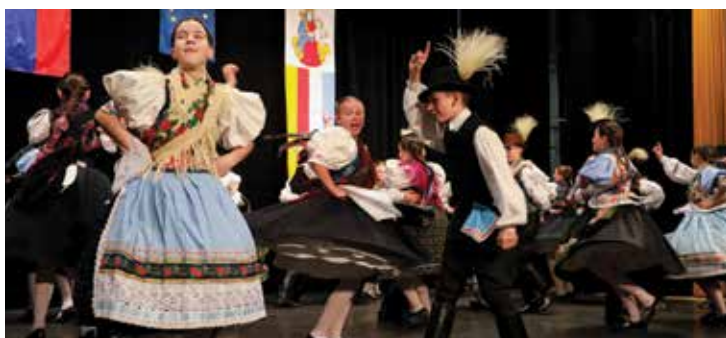
A Nagy Csali fellépése