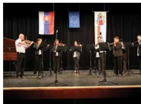
A Harmonia Classica műsora