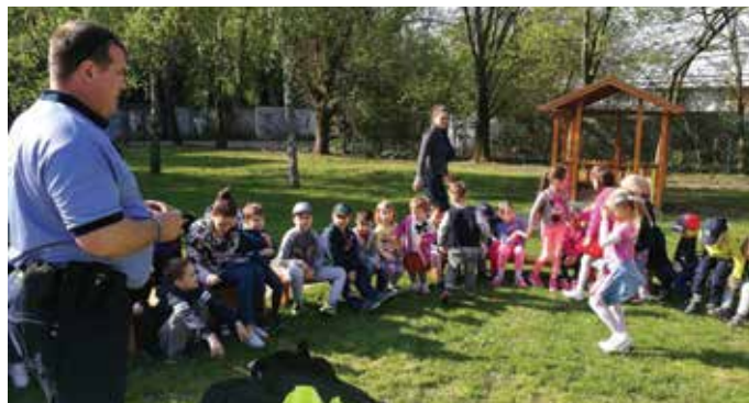
A Szél utcai óvodában