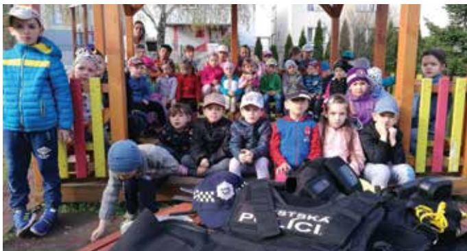
A Mária utcai óvodában