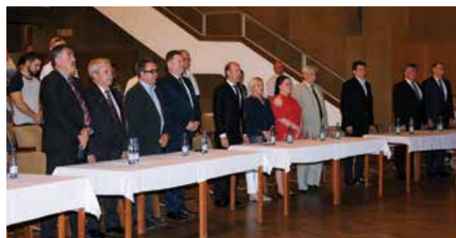
Önkormányzati képviselők egy csoportja