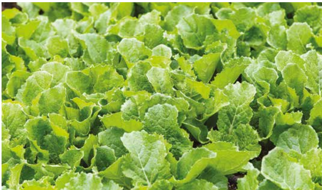
A mustár mint zöldrágya

Ha az almát tárolásra szánjuk, erre a legalkalmasabbak a hűvös, de nem túl száraz pinchhelyiségek. Ezeket előtte ajánlatos kifertőtlen-